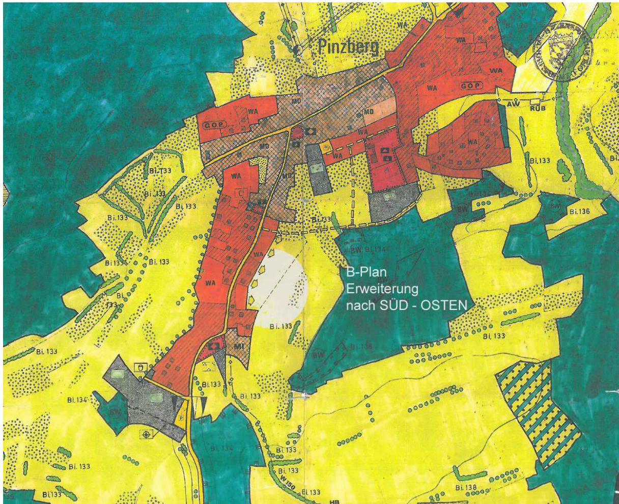
Auszug aus dem Flächennutzungsplan der Gemeinde Pinzberg; Geltungsbereich B-Plan „Kapellenstrasse“

Die Fläche des Baugebietes ist im wirksamen Flächennutzungsplan als Fläche für die Landwirtschaft gekennzeichnet – der direkte planerische Bezug zum WA Wohngebiet Allgemein lässt eine Definition als Bauerwartungsland zu. In der laufenden Änderung des Flächennutzungsplanes werden die aktuellen Planungsabsichten des aufliegenden Bebauungsplanes mit berücksichtigt. Der Landschaftsplan wird entsprechend angepasst.